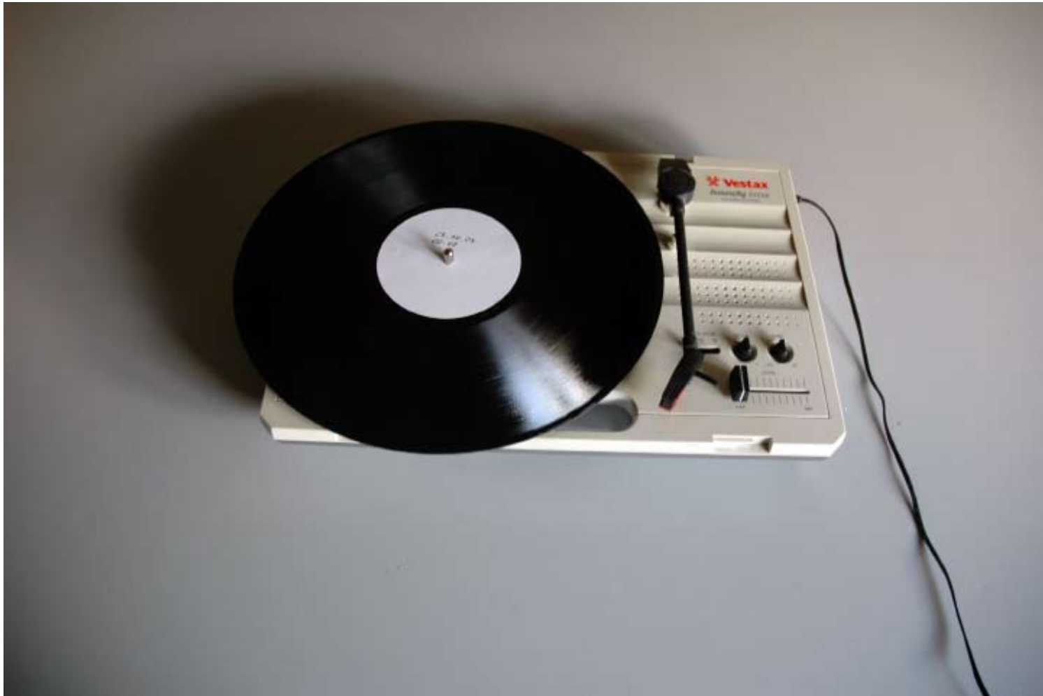
Detailansicht Schallplatte, Leipzig, 2010