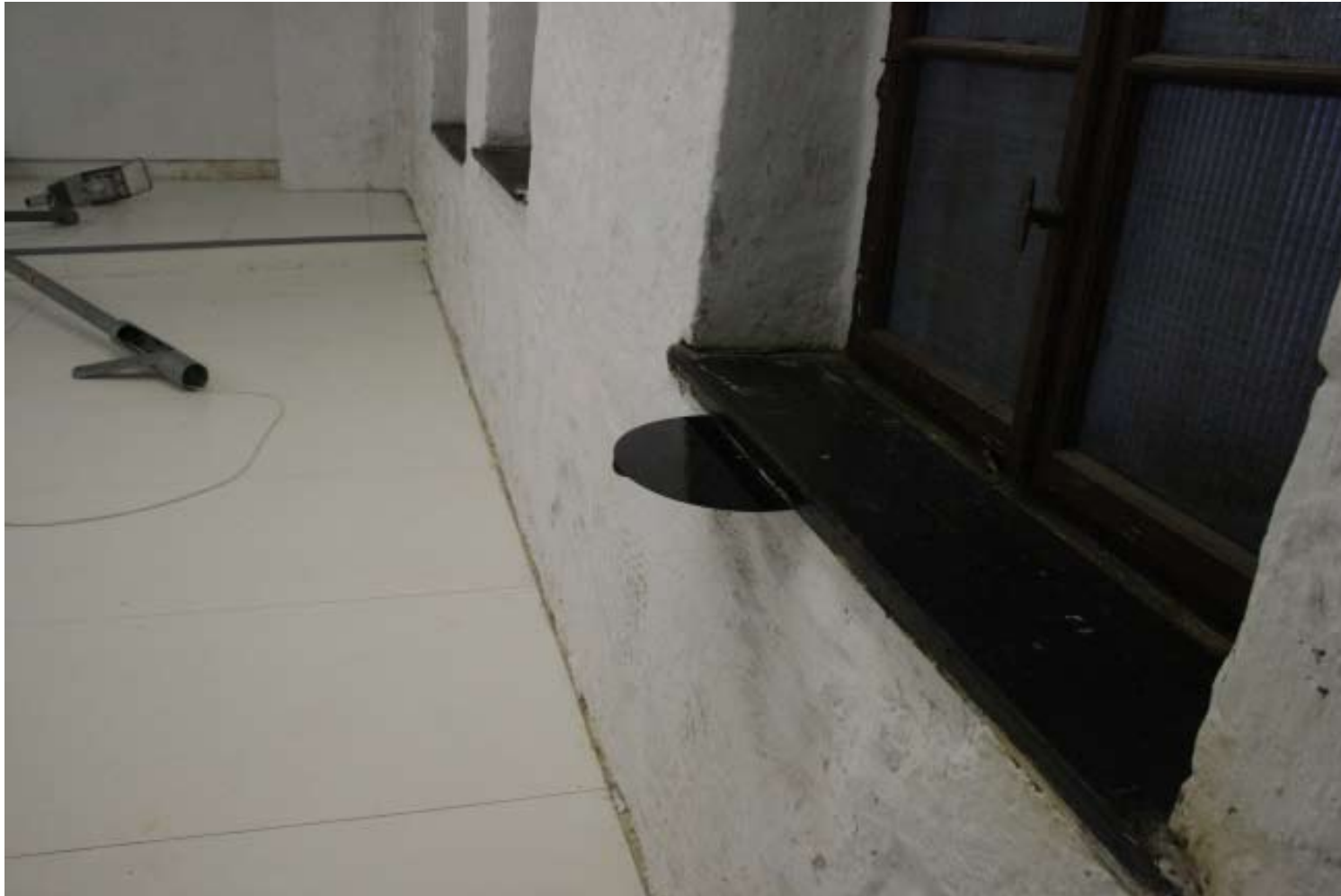
Installationsansicht Setting 9.7.2010 (Schallplattenrohling) , Schallplattenrohling, Leipzig, 2010 LIGHT COME, LIGHT GO , Juli 2010, Galerie KUB, Leipzig