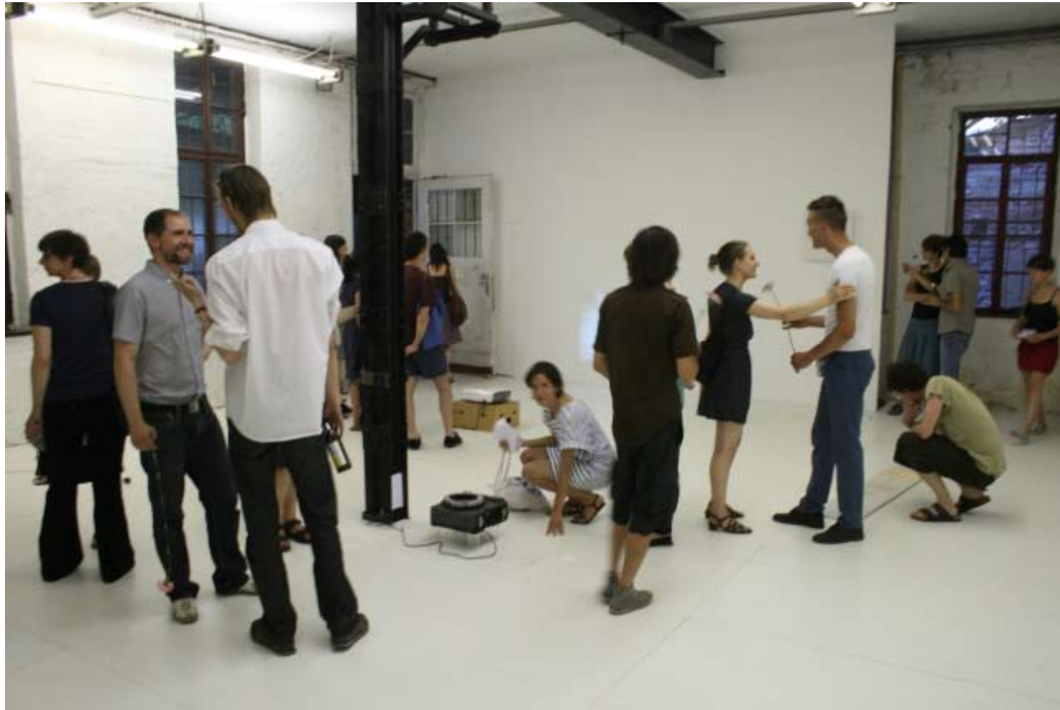
Ausstellungsansicht LIGHT COME, LIGHT GO zum Eröffnungsabend mit Gästen und ausstellenden Künstlern, Juli 2010, Galerie KUB, Leipzig