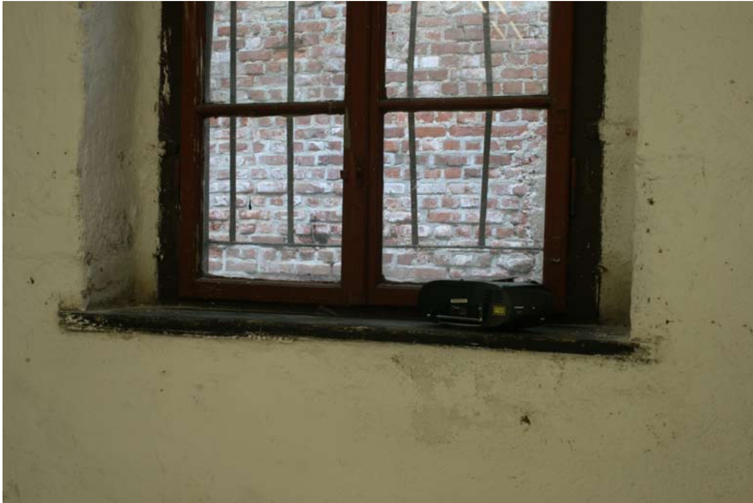
Installationsansicht Setting 9.7.2010 (CD-Player) , CD-Player, Leipzig, 2010 LIGHT COME, LIGHT GO , Juli 2010, Galerie KUB, Leipzig