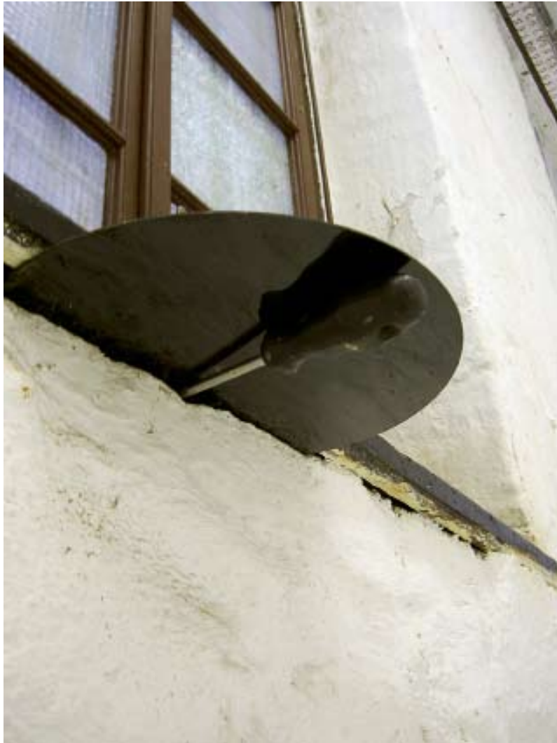
Detailansicht Setting 9.7.2010 (Schallplattenrohling) , Schallplattenrohling, Leipzig, 2010 LIGHT COME, LIGHT GO , Juli 2010, Galerie KUB, Leipzig