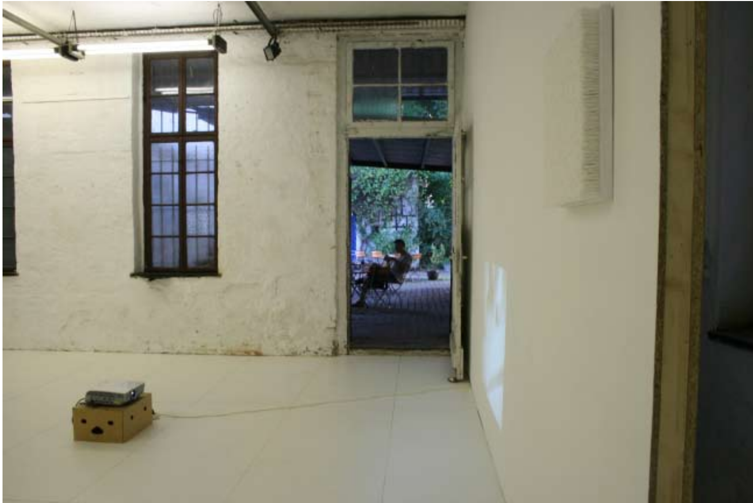
Installationsansicht Setting 9.7.2010 (Schallplattenrohling) , Schallplattenrohling, Leipzig, 2010 LIGHT COME, LIGHT GO , Juli 2010, Galerie KUB, Leipzig