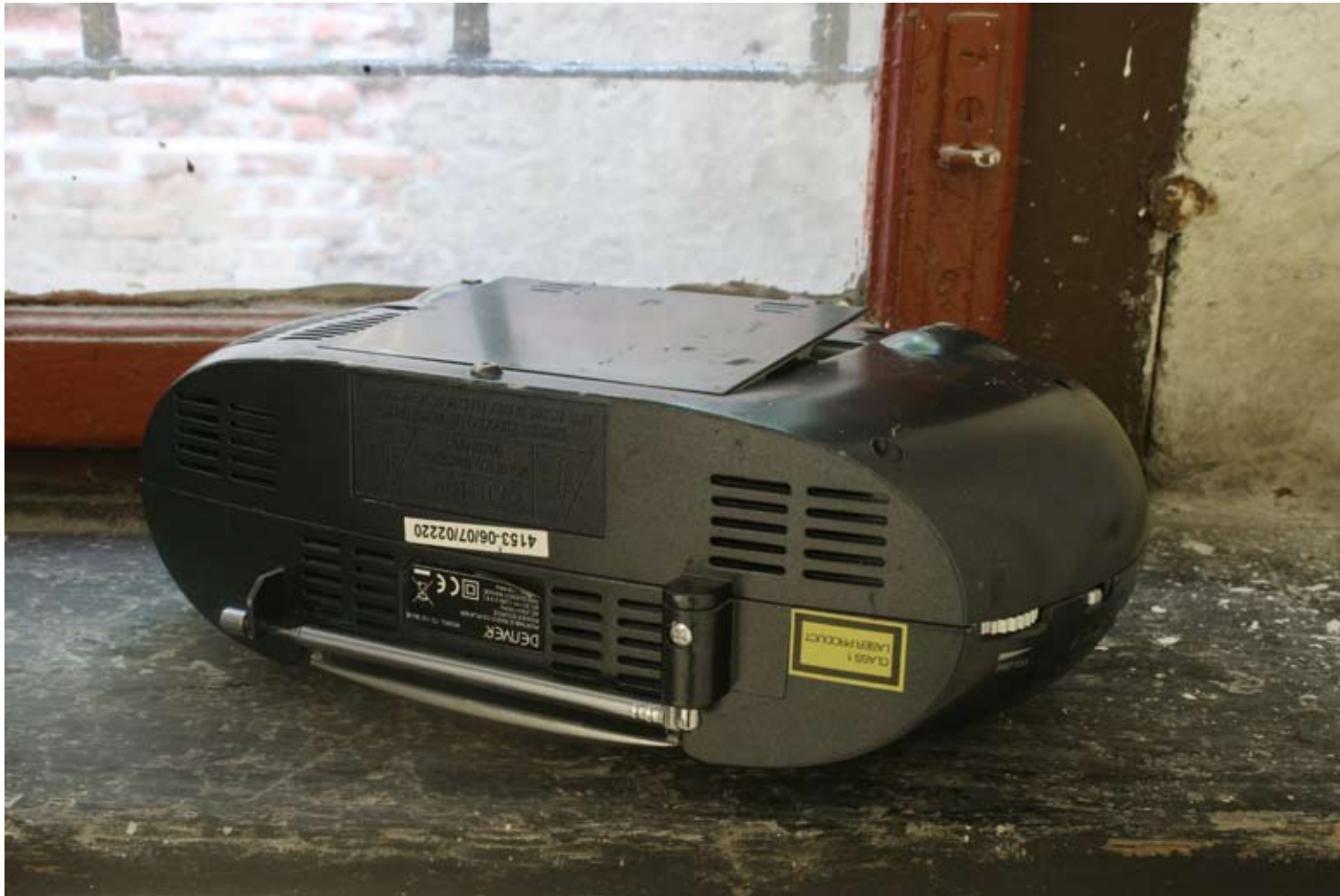
Detailansicht Setting 9.7.2010 (CD-Player) , CD-Player, Leipzig, 2010 LIGHT COME, LIGHT GO , Juli 2010, Galerie KUB, Leipzig